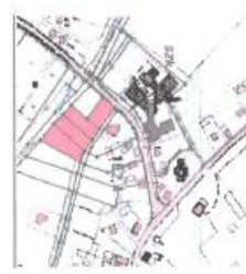
Skala orientacyjna w skali 1:10 000