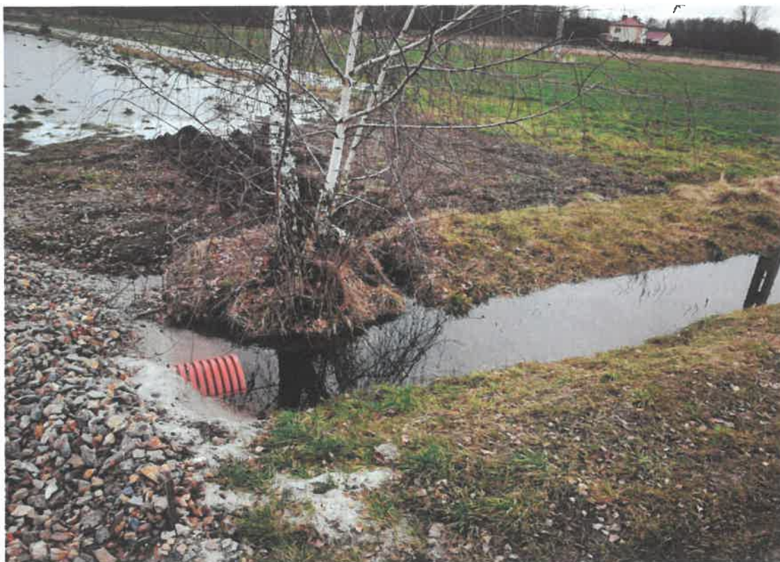
Zdjęcia rowu wypełnionego wodą