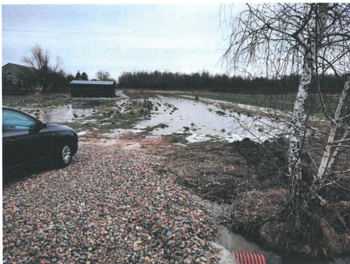
Widok na działki od strony drogi 767