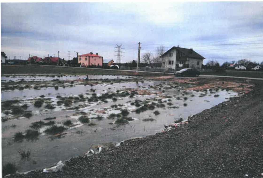
Widok na działki od boku